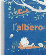
Coralie Saudo Mélanie Grandgirard «L'albero» Lapis pp.40, €14,90, 3+