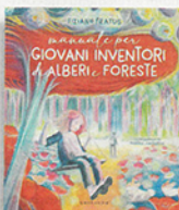
Tiziano Fratus «Manuale per giovani inventori di alberi e foreste» Gribaudo pp.96, €14,90, 8+

Abbracciare un albero: ma fatelo davvero! —