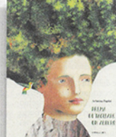
Arianna Papini «Prima di tagliare un albero» Camelozampa pp.36, €17, 5+