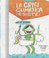
Alterales «La crisi climatica esiste (non è un unicorno)» Mondadori pp.112, €16, 10+