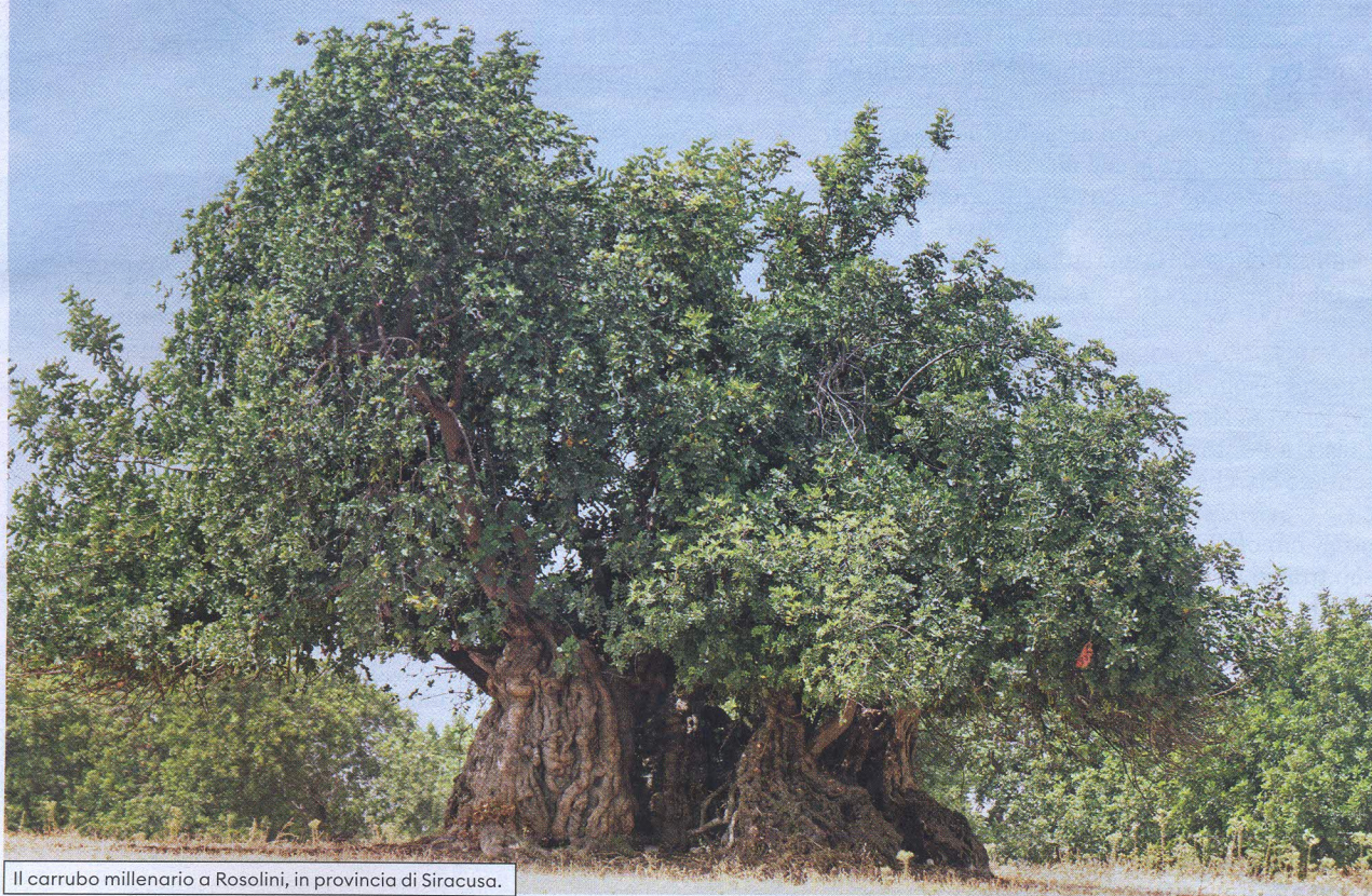
Il carrubo millenario a Rosolini, in provincia di Siracusa.

A Sud di Siracusa, dirigiti verso Modica e Ragusa e ti ritroverai immersa nei campi coltivati a carrubo, un albero dell'antica tradizione contadina, prezioso per i suoi baccelli. Qui ci sono anche